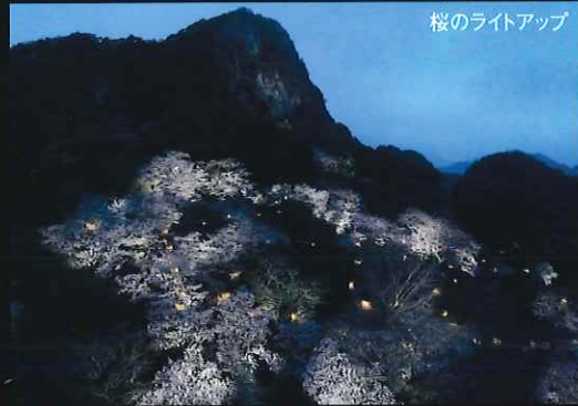
桜のライトアップ